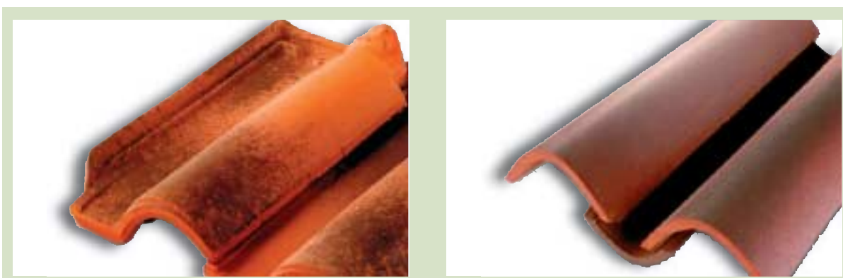
Fig. 2 - Immagini di alcuni dei campioni di elementi per copertura in laterizio, oggetto dell'indagine.

Per quanto riguarda i metalli, vi è, sempre per gli stessi prodotti, un valore che supera i limiti, ovvero il Bario con 1,26 mg/l e 1,59 mg/l, rispetto ad un limite di 1 mg/l; livelli di attenzione si riscontrano, inoltre, per il parametro Cromo (con valori molto vicini al limite previsto, ovvero 48 microgrammi/l e 46 microgrammi/l rispetto al limite di 50) e per il Selenio (8 microgrammi rispetto a 10).